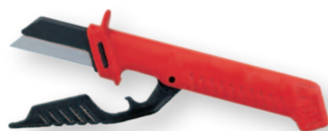
Dao cắt cáp AV3920