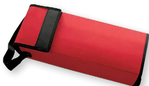
Bao mềm - AB6210